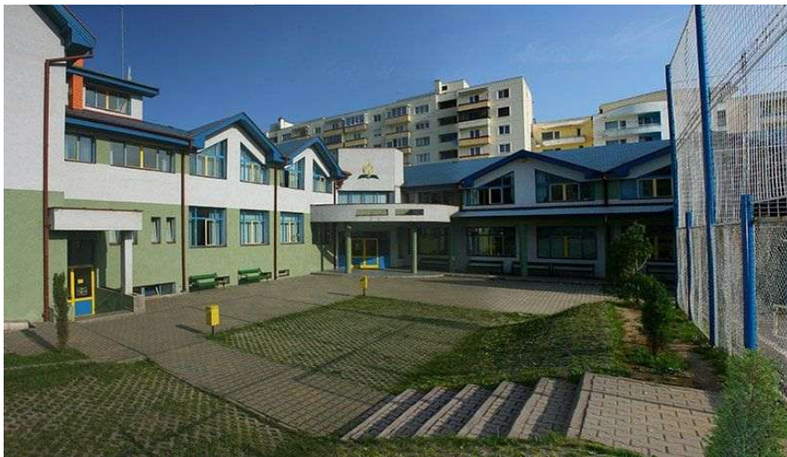
STRUCTURĂ – ȘCOALA PRIMARĂ „OMEGA” NAZNA